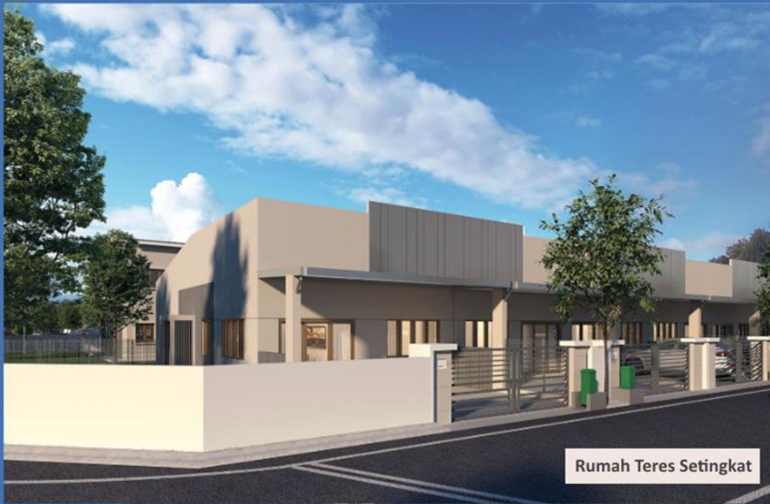
Rumah Teres Setingkat