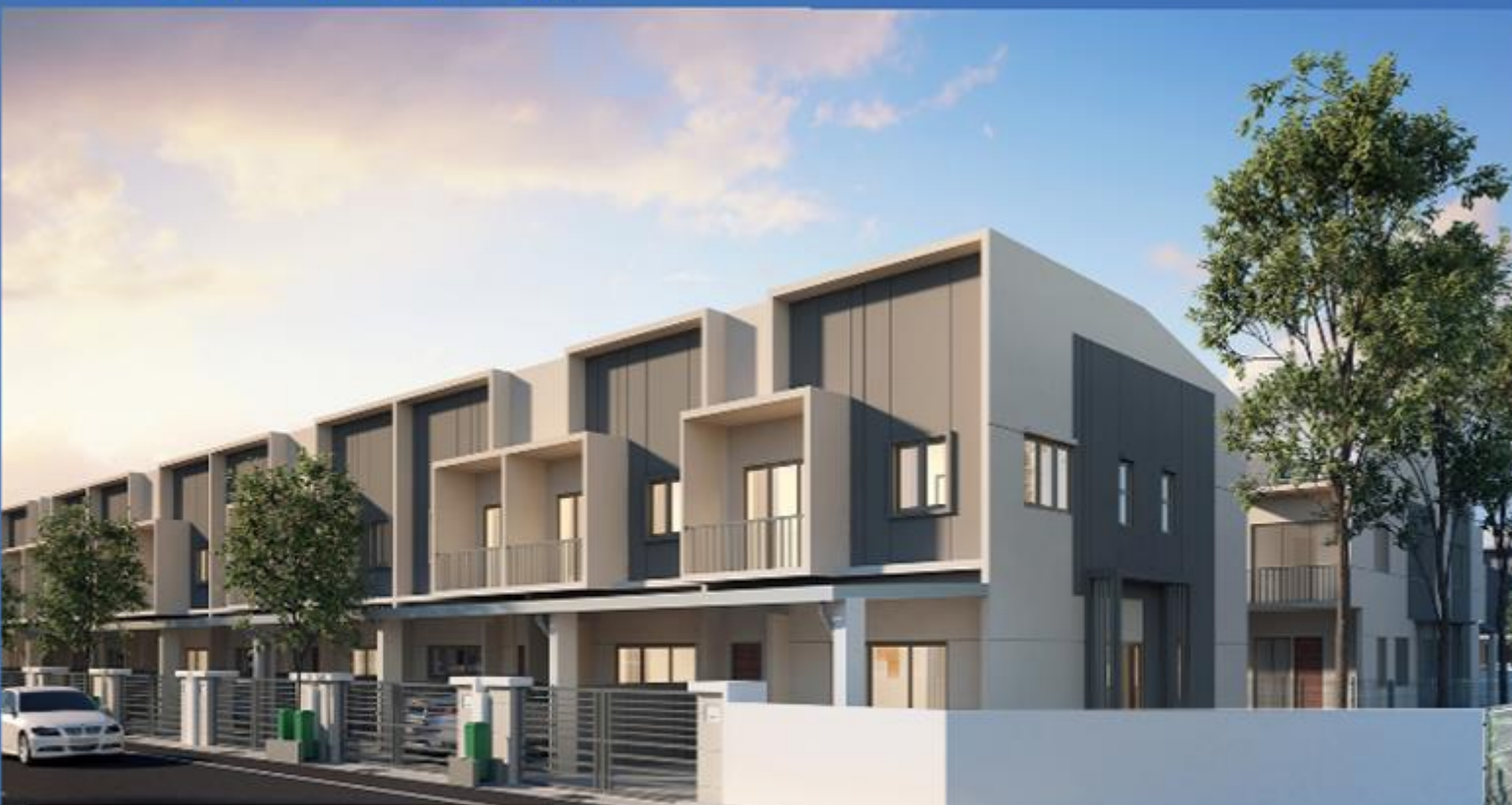
Rumah Teres Dua Tingkat

Selamat datang ke amanplus TAMAN KUANTAN JAYA