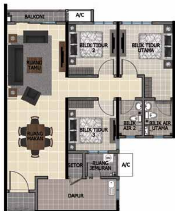
Susunatur Unit Biasa: 1,000 kps - 792 unit