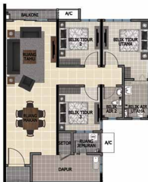
Susunatur Jenis Mesra OKU: 1,000kps - 8 unit